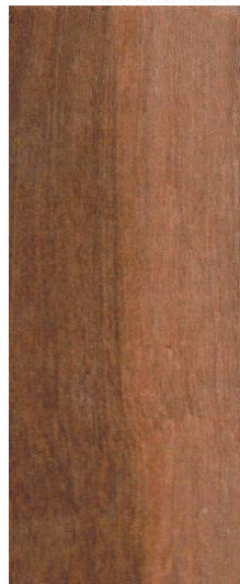
Kernhout en spint