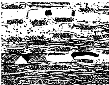
Fotomicrografia - Corte longitudinal - 50X