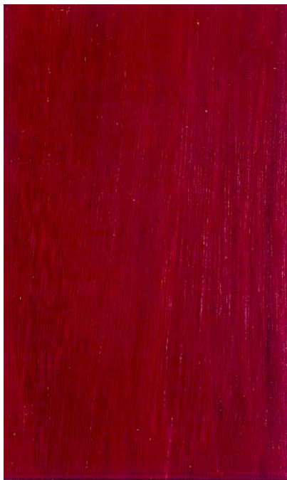
Corte tangencial Flatsawn